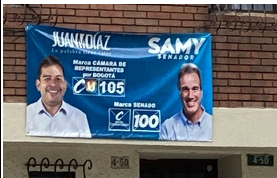
Un (1) Aviso en Fachada con publicidad política